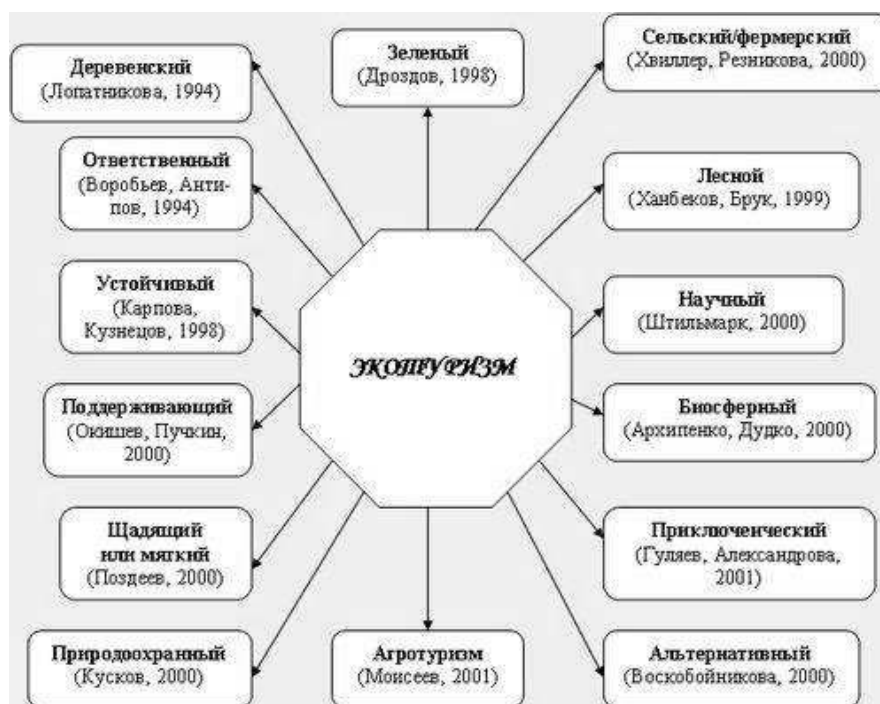
Рис. 6. Место сельского и экотуризма в структуре устойчивого развития сельских территорий

Сохранение основной функции по производству продовольствия оправдано считать традиционной парадигмой развития сельских территорий. Она не противоречит, а наоборот, подчеркивает важность функционального обогащения сельских территорий посредством развития непродовольственной сферы, в которой важное место принадлежит спортивно-оздоровительному туризму. Это вид деятельности представляет собой взаимодействие интересов получающих рабочие места сельских жителей, задействованных в сферах услуг, и интересов горожан и других «гостей», реализующих свои цели оздоровления, отдыха, спорта и познания. Это могут быть международные соревнования по спортивному ориентированию: открытый Кубок Пермского края 2016 г. в Осинском районе и «Чемпионат ВЕТЕРАНОВ» в Добрянском районе Пермского края (рис. 5). Все можно объединить в большой цикл туристических мероприятий под общим названием «Пермский период» с проживанием на лоне природы.