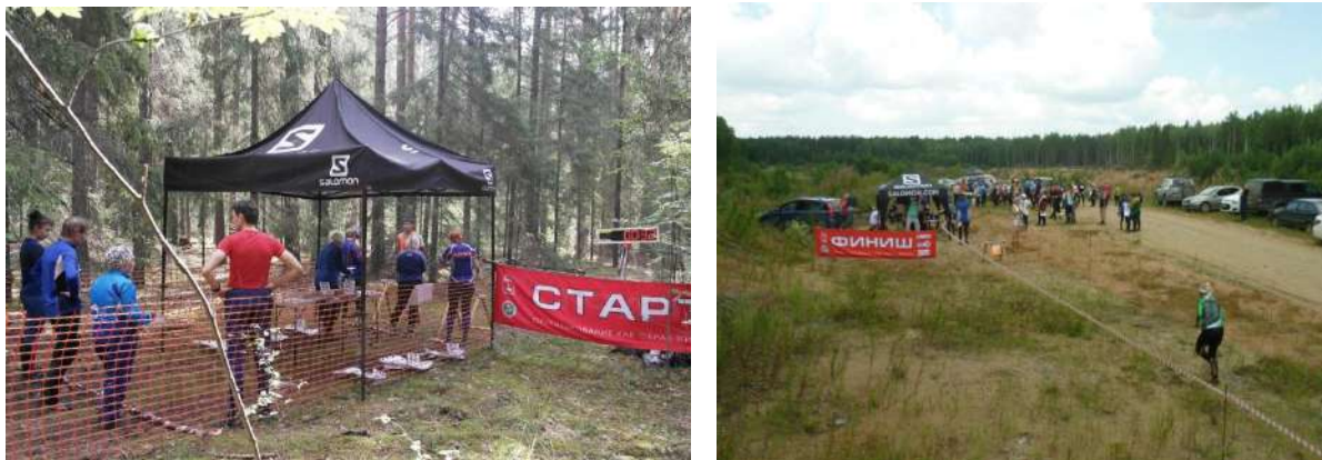
Рис. 8. Партнерство между государством, органами местного самоуправления, бизнесом и сельским населением, спортсменами-туристами в целях достижения устойчивого развития сельских территорий

Территории (акватории) парков включают природные комплексы и объекты, которые имеют значительную экологическую и эстетическую ценность и предназначены для использования в природоохранных, просветительных и спортивно-оздоровительных целях [11].