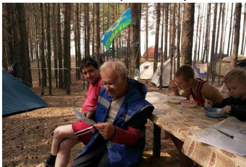
Рис. 4. Полевые работы по теме разнообразных форм и видов деятельности. ОХТРЗ «Осинская лесная дача» (зона особой природной ценности)

Благодаря переписи 2006 г. было признано, что они играют серьезную, но недооцененную роль в экономике страны. В структуре сельхозпродукции их доля составляет более 40 % (а по отдельным видам продукции доходит и до 70 %), но только сельхозперепись позволяет получить полную картину по этой категории хозяйств населения. Перепись позволяет уточнить количество всех сельскохозяйственных единиц всех организационных правовых форм во всех регионах, их ресурсный потенциал: обеспеченность землей, трудовыми ресурсами, техникой, производственной инфраструктурой. Переписные листы нынешней переписи дополнены рядом вопросов, существенных для ведения современного сельского хозяйства. Впервые сельхозпроизводителей спрашивают о применении ими передовых методов ведения хозяйства (биологические методы защиты растений от вредителей и болезней, капельная система орошения, возобновляемые источники энергоснабжения и др.), о получении хозяйствами субсидий и дотаций, о привлечении кредитных средств и т. д. Будут получены отсутствующие в текущей статистике и данные по растениеводству и животноводству.