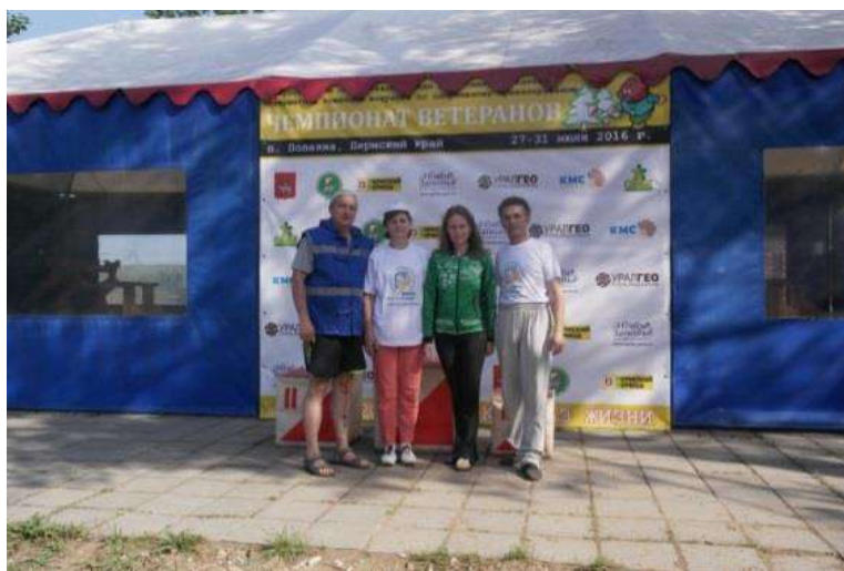
Рис. 5. Организаторы и специалисты «Чемпионата ВЕТЕРАНОВ» в Добрянском районе Пермского края. ТБ «СВЯЗИСТ» (парк советского периода)

Однако все эти проблемы, безусловно, грамотнее и быстрее решаются при наличии политической поддержки центра – соответствующей государственной программы (подпрограммы