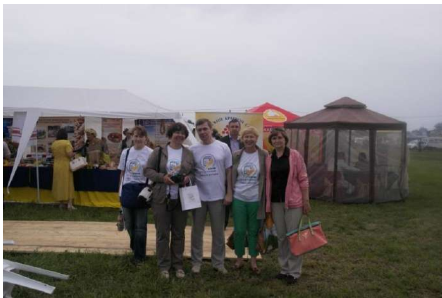
Рис. 2. Главные эксперты ВСХП 2016. Агротехнологический парк «Пермский». Мероприятия АгроФЕСТ-16