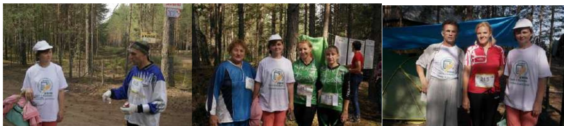
Рис. 3. Специалисты ВСХП-16 на изыскательских работах в тематическом парке. ТБ «СВЯЗИСТ» (парк советского периода). Экспресс-опрос

телей в текущем режиме наблюдаются выборочно, а это требует регулярного уточнения генеральной совокупности объектов сельскохозяйственной переписи – базы данных о сельскохозяйственных производителях – объектах федерального статистического наблюдения, на основе которой проводятся текущие выборочные статистические обследования в межпереписной период (рис. 3). Прежде всего, это касается личных подсобных хозяйств, которые являются ядром сельского туризма. Как правило, тематические парки ограничиваются единичными домохозяйствами, которые расположены в пограничных зонах.