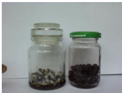
Рис. 4. Слева черника, не подвергавшаяся воздействию озона, справа – обработанные озон в течение получаса ягоды черники

В случае обработки в течение получаса озонно-воздушной смесью с концентрацией озона 8–10 мг/л ягод черники и вишни при их дальнейшем хранении в герметичной таре не наблюдается никаких признаков порчи, заплесневелости или разложения этих продуктов в течение как минимум двух с половиной лет. Они сохраняют изначальный вкус, цвет и запах.