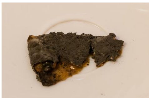
Рис. 1. Поверхность дыни, покрытая слоем плесени Penicillium glaucum