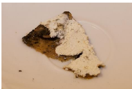
Рис. 2. Та же поверхность после одного часа обработки озоном в концентрации 8 мг/л

Обеззараживаются воздух, оборудование, пол, стены и потолок производственных помещений и даже труднодоступные для традиционных методов санобработки участки. Озон является наилучшим дезинфектантом, например, для предприятий молочной промышленности: в отличие от других дезинфектантов он не создает вторичного загрязнения. Озоновая дезинфекция не требует последующей дегазации или промывки пищевых продуктов, изделий и оборудования.